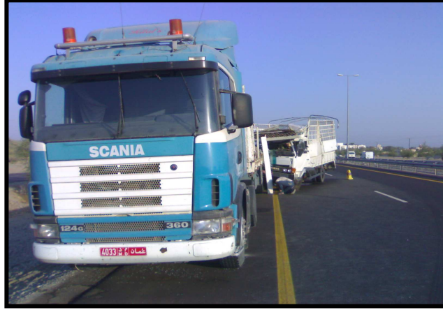
المشهد الأمامي يظهر إصطدام المباشر للشاحنة بأخرى

في تاريخ 17 أكتوبر من العام 2006 في تمام الساعة 1:00 صباح إستوفق مرور الطريق/ لشرطة عمان السلطانية سائق كان يقود شاحنة في رحلته التابعة لشركة تنمية نفط عمان على الطريق العام، حيث ترجل السائق متجها نحو رجال الشرطة الذين توقفوا خلف الشاحنة حيث وقف السائق على حافة المقطورة ، بينما كان رجال الأمن يتفحصون صلاحية أوراق الشاحنة إذا بشاحنة أخرى من الطرف الثالث تفقد السيطرة نتيجة السرعة الزائدة وتتجه نحوهم حيث إصطدمت بسيارة الشرطة وصدمت السائق مباشرة نحو المقطورة.