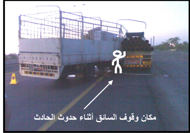
المشهد الخلفي يظهر إصطدام المباشر للشاحنة بأخرى

النتيجة: وفاة السائق الأول مباشرة نتيجة الإصطدام العنيف بمقطورة كما أصيب السائق الثاني بإصابات عادية ، أما بنسبة للمركبات فلقد تضررت المركبة الثانية بشركة كبير من الأمام أما بخصوص المركبة الاولى فلقد تضررت حمولتها بأضرار عادية نسبيا ، أما ظابط الشرطة فقد أصيب هو أيضا في هذا الحادث.